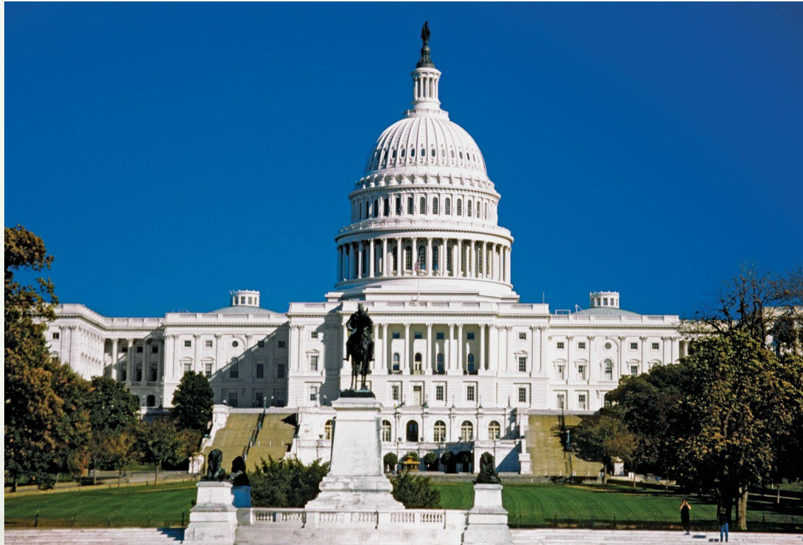
Capitolio de Estados Unidos